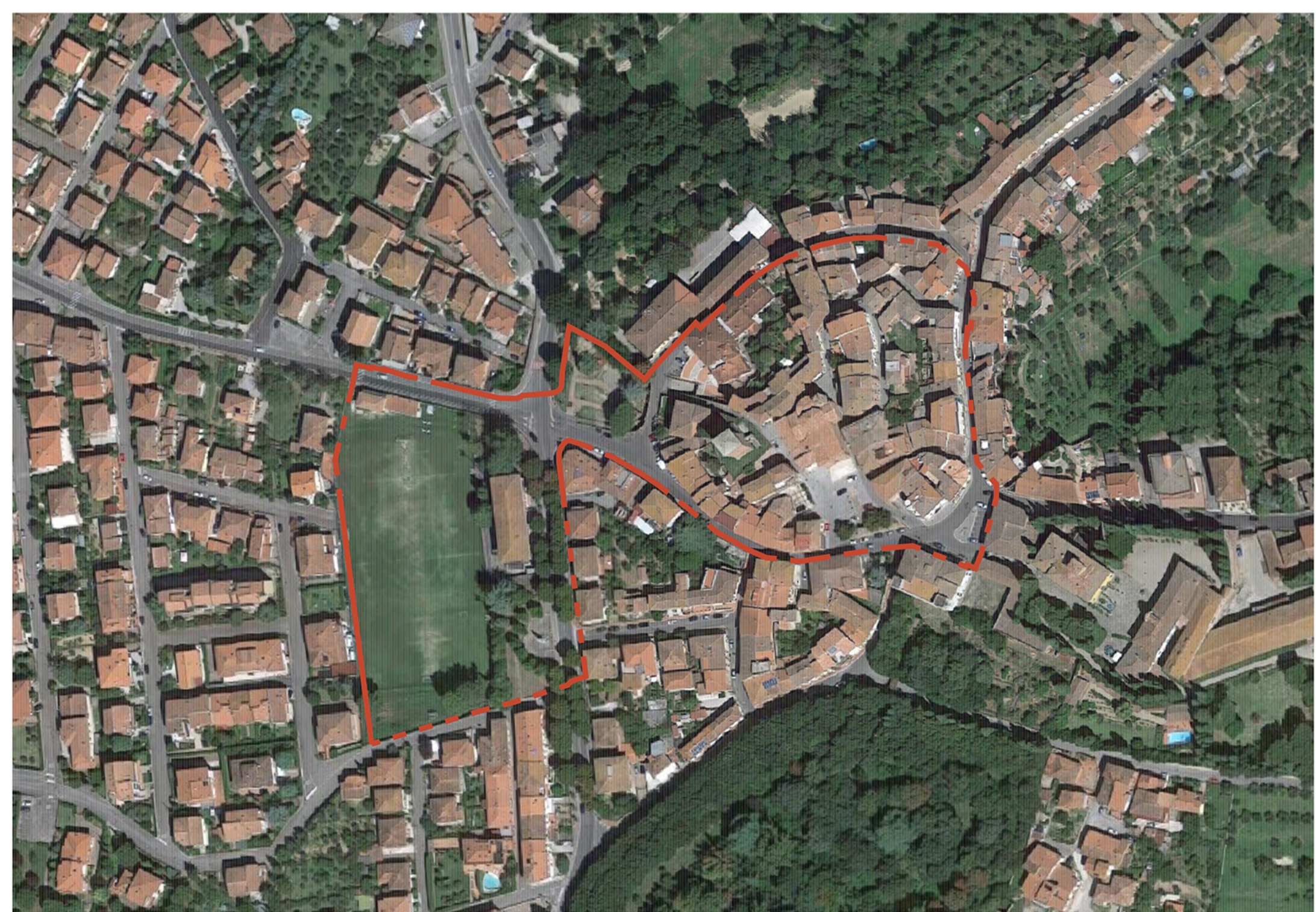
BETTOLE: Ortofotocarta 1:2000